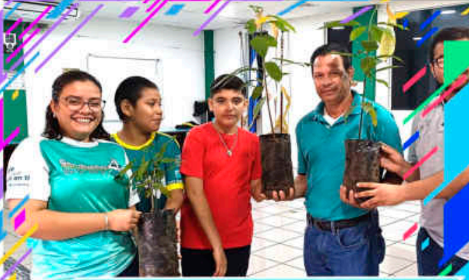
Campaña de Reforestación Ambiental