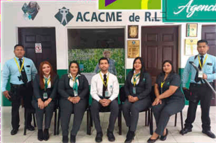
Agencia San Julián