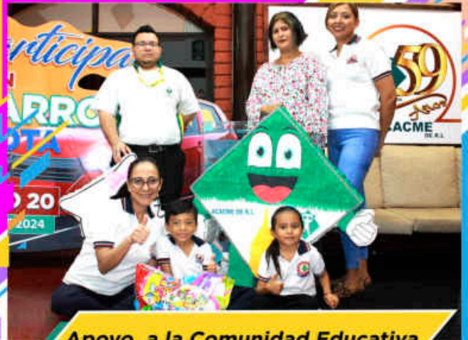
Apoyo a la Comunidad Educativa