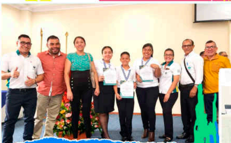
Fase Zonal II Obteniendo 1° lugar en las 3 Categorías