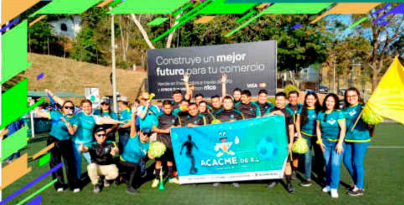
Torneo FEDECACES 2024