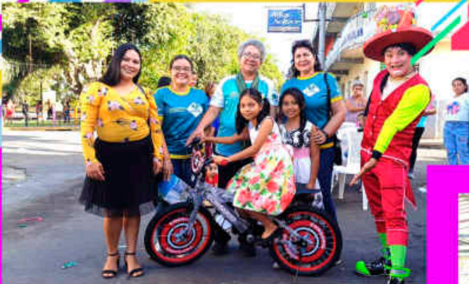
Fiesta Navideña Infantil 2024 Agencia San Julián