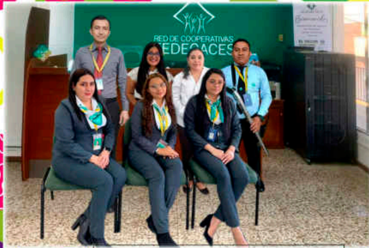
Agencia San Salvador