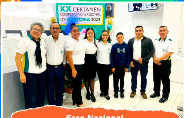
Fase Nacional Obteniendo 3° lugar en las 3 Categorías