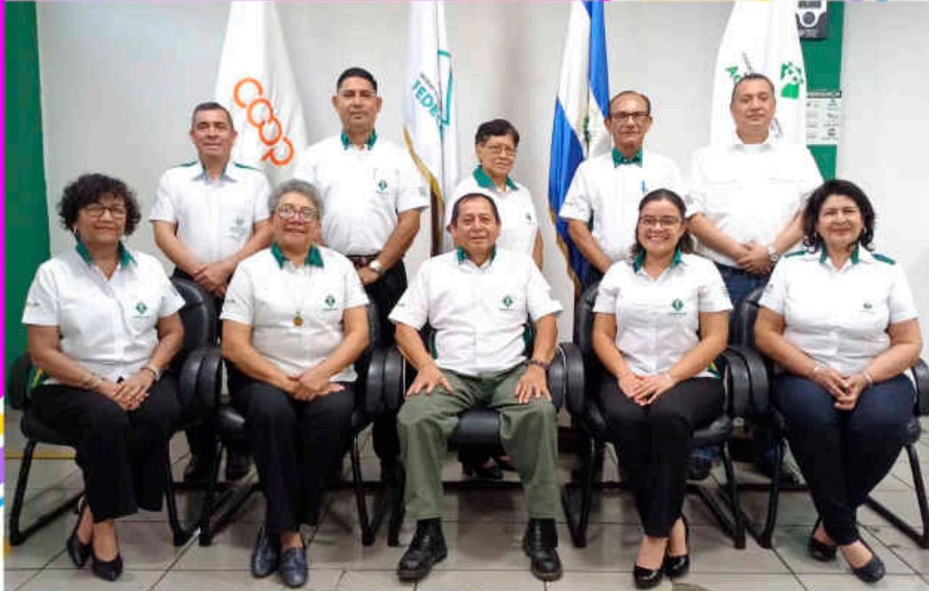
CONSEJO DE ADMINISTRACIÓN