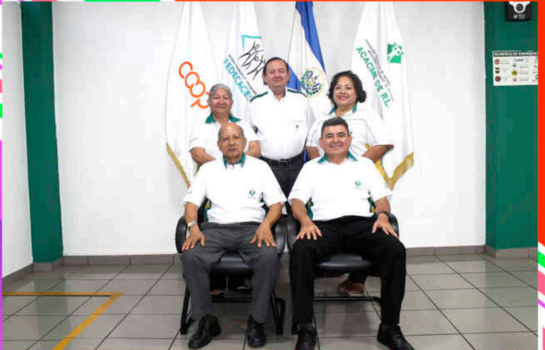
JUNTA DE VIGILANCIA