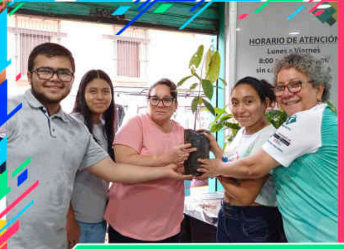
Campaña de Reforestación Ambiental