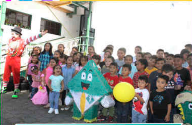
Fiesta Navideña Infantil 2024 Agencia Sonsonate