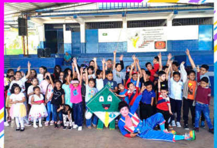
Fiesta Navideña Infantil 2024 Agencia Ahuachapán