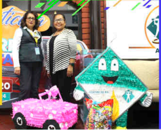
Apoyo a la Comunidad Educativa